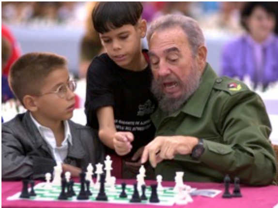
Fidel Castro mentre sta analizzando una partita in occasione di un torneo giovanile a L'Avana il 7 dicembre 2002