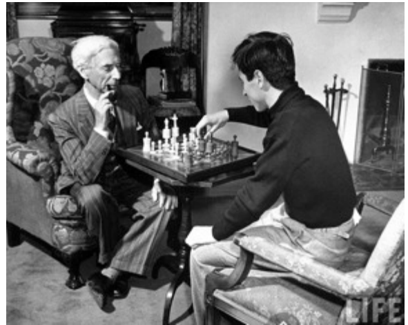
il filosofo Bertrand Russel