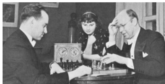
Il violinista David Oistrakh e il compositore Sergej Prokofiev

1.d4 Cf6, 2.c4 e6, 3.Cc3 Ab4 i due compositori hanno dato vita alla difesa Nimzoindiana, 4.Ag5 Cc6, 5.e3 0-0, 6. Ad3 d5, 7.Cge2 a5, 8.Dc2 h6, 9.h4 hxg5, 10.hxg Te8? 10...Ce4 era migliore. 11.gxf6 Dxf6, 12.0-0-0 dxc, 13.Ah7+