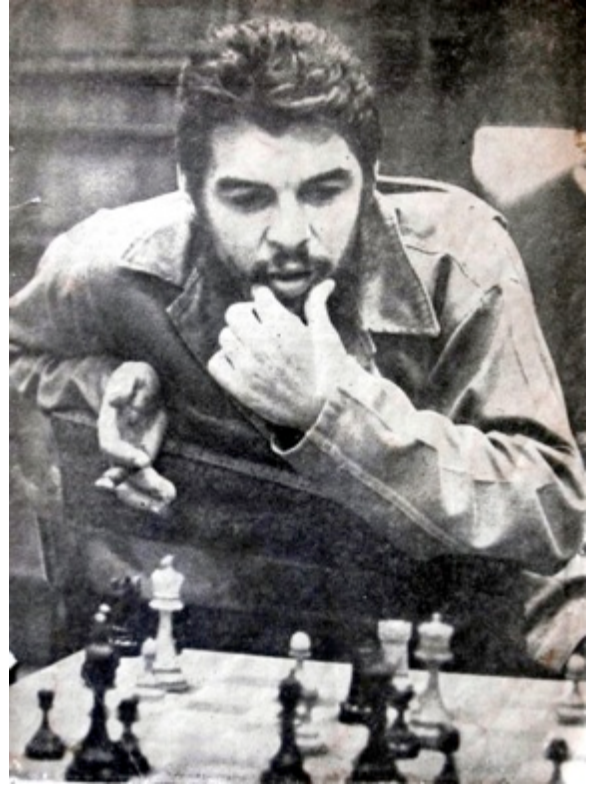
Ernesto Che Guevara