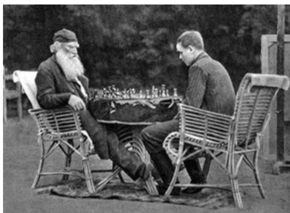
l'autore di Guerra e pace Lev Tolstoj

1.e4 e5, 2.d4 exd4, 3.c3 dxc3, 4.Ac4 cxb2, 5.Axb2 Tolstoj gioca il famoso Gambetto danese che consiste nel