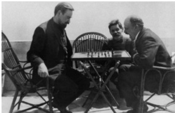
da sinistra: Alexander Bogdanov, Maksim Gorkj e Lenin a Capri nel 1908.

1.e4 Cf6 difesa Aljechin, 2.e5 Cd5, 3.d4 d6, 4.c4 Cb6, 5.f4 dxe5, 6.fxe5 Cc6,