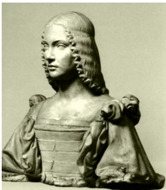
La first lady del rinascimento, la marchesa di Mantova Isabella d'Este, ricevette un'educazione di grande spessore culturale. La sua passione per gli scacchi fu tale che il matematico e fondatore della contabilità, Fra Luca Pacioli (1445-1517) scrisse e le dedicò nel 1499 il manoscritto De ludo scachorum .