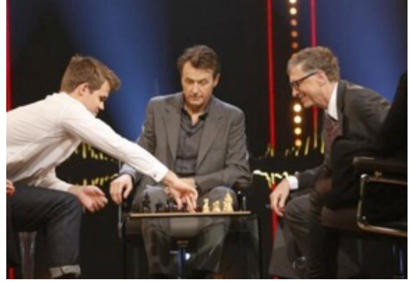
Bill Gates in una partita amichevole con il campione del mondo Magnus Carlsen