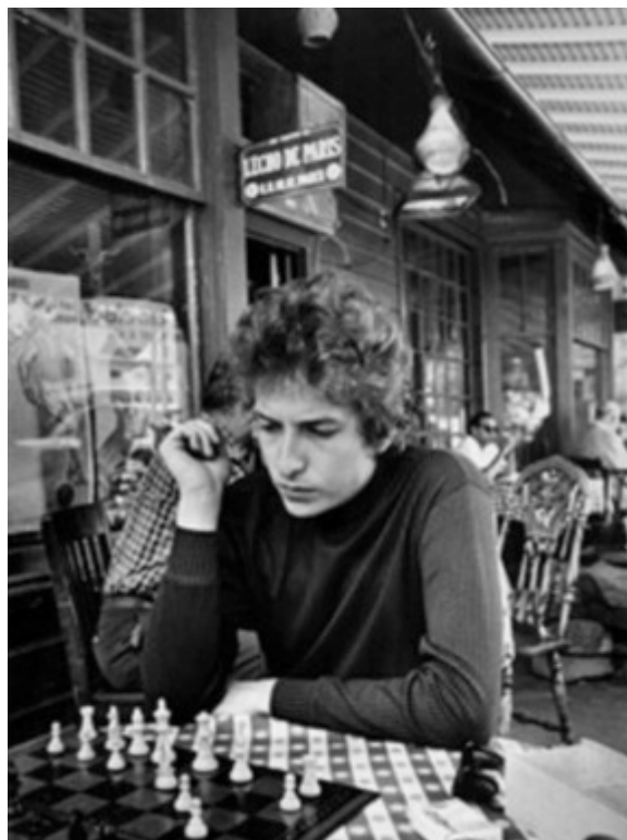
Il cantautore e compositore di musica folk Bob Dylan