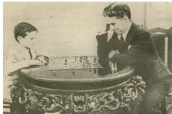
Charlie Chaplin e il giovanissimo Samuel Reshevsky

1.e4 e5, 2.Cf3 Cf6 difesa russa, 3.d4 exd4, 4.e5 Ce4, 5.De2 Cc5, 6.Cxd4 Cc6, 7.Ae3 Cxd4, 8.Axd4 Ce6, 9.Ac3 Ae7, 10.Cd2 0-0, 11.Ce4 d5, 12.0-0-0 Ad7, 13.Cg3 c5, 14.Ad2 b5, 15.Cf5 d4, 16.h4 Cc7, 17.Cex7+ fino a questo punto la partita è stata equilibrata. "Charlot" ha un leggero ritardo di sviluppo a causa