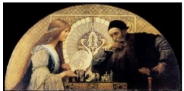
Isabella d'Este e Leonardo da Vinci (?)