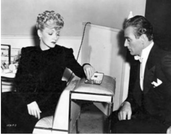
l'attrice Marlene Dietrich e John Wayne.