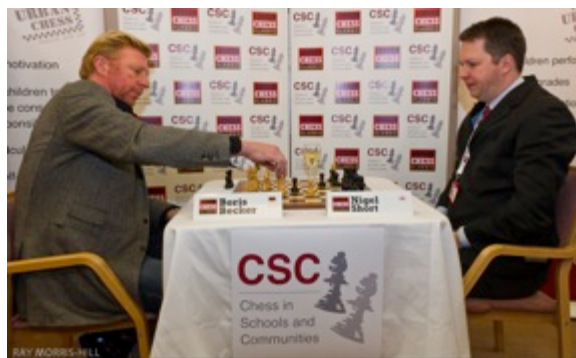
il tennista Boris Becker alle prese con il GM Nigel Short.