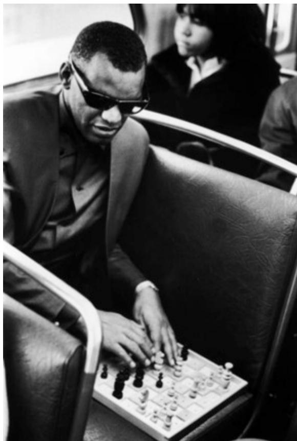
il cantante e pianista Ray Charles, nonostante la cecità, giocava a scacchi utilizzando una scacchiera speciale.