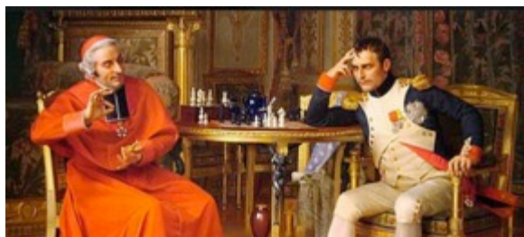
Napoleone e il cardinale Fesch mentre giocano a scacchi

1.e4 e5, 2.Cf3 Cc6, 3.d4 la spinta del pedone di donna caratterizza la partita scozzese, 3...Cxd4, 4.Cxd4 exd4, 5.Ac4!? 5.Dxd4 sarebbe stato più semplice