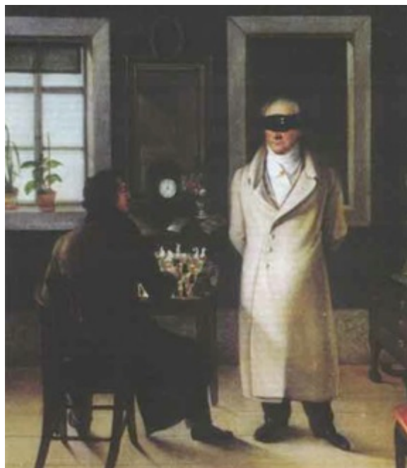
Wolfgang von Goethe ritratto mentre gioca una partita alla cieca.