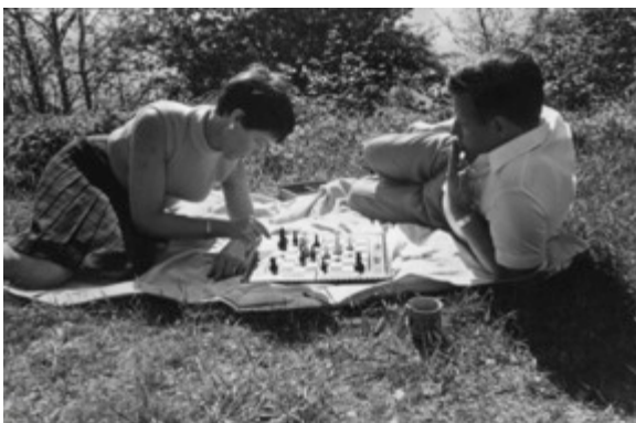
Helmut Schmidt con la moglie Loki durante una partita in campagna.