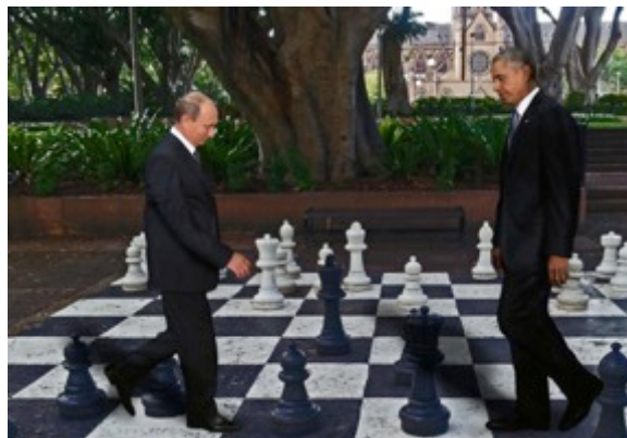
Putin e Obama alla scacchiera gigante durante un momento di relax.